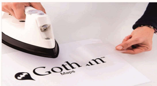
POLIURETANO BAJA FUSIÓN