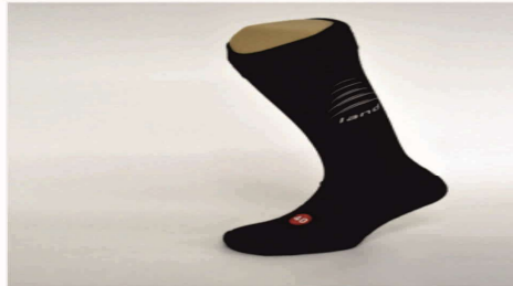
BERTEX BAJA FUSIÓN