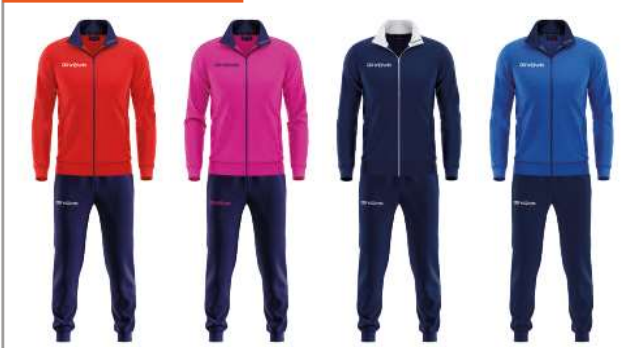
TUTA TORINO - TR031