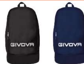
ZAINO GIVOVA SPORT BIG - B007