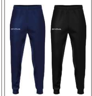
PANTALONE GIVOVA ONE - P019