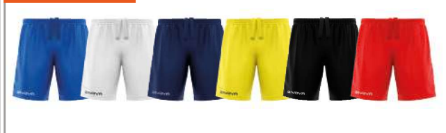
SHORT CAPO - P018