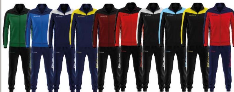
TUTA ROMA - TR036