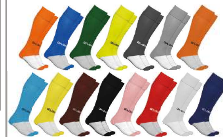
CALZA CALCIO - C001