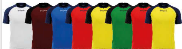
SHIRT CAPO - MAC03