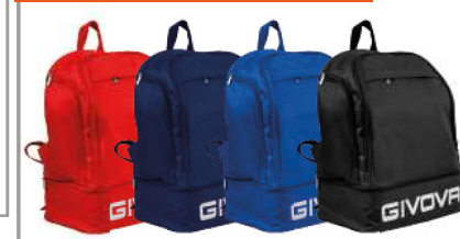
ZAINO GIVOVA SPORT - ART. B029