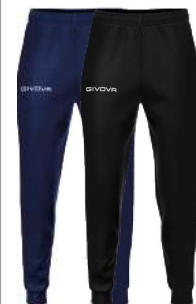
PANTA GIVOVA ONE - P019 -