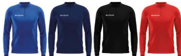
MAGLIA POLARFLEECE (HALF ZIP) 500 - MA023