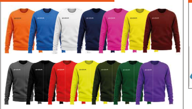
MAGLIA G/COLLO GIVOVA ONE - MA019