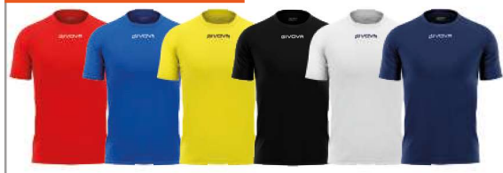
SHIRT CAPO - MAC03