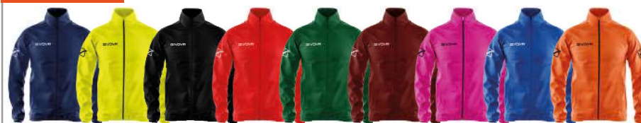
RAIN BASICO - RJ001