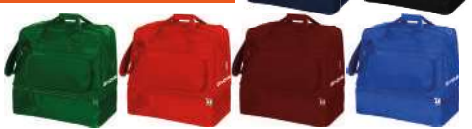
BORSA REVOLUTION BIG - B030 -