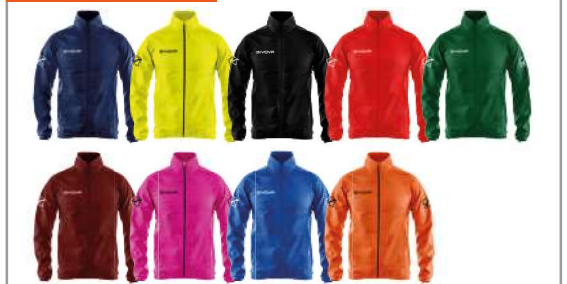
RAIN BASICO - RJ001