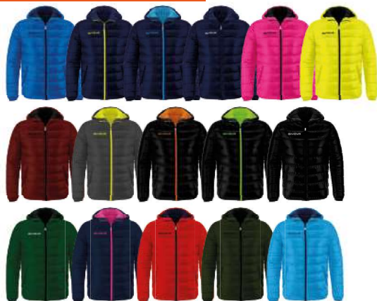
GIUBBOTTO OLANDA - G013